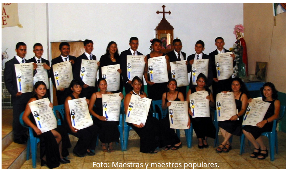
Foto: Maestras y maestros populares.

No ha sido nada fácil pero seguimos caminando, seguimos avanzando en educación. A 25 años del primer retorno a casa, Santa Marta seguirá siempre adelante abriendo caminos y construyendo su propio futuro, rompiendo los esquemas marcados en el departamento y en el país y demostrando que con esfuerzo y organización se puede llegar muy lejos.