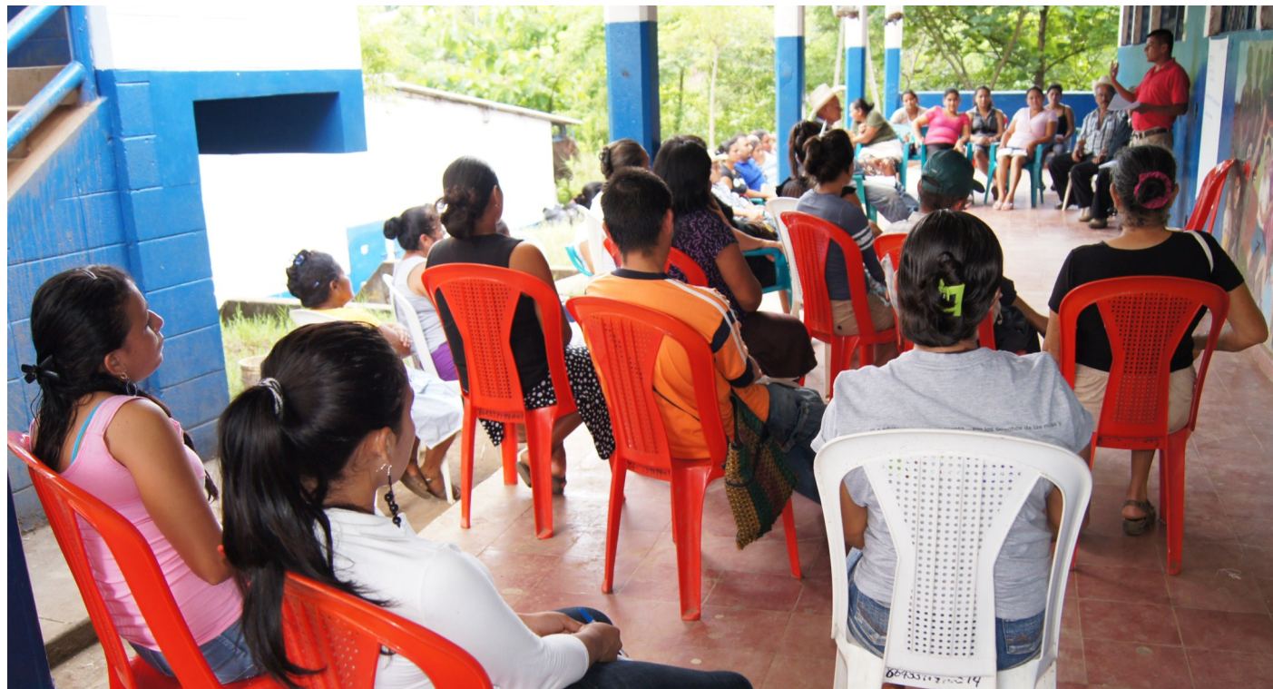
Fotos: Reunión de coordinadores y coordinadores de Comités de Base en las instalaciones del Complejo Educativo "10 de Octubre", 1987.

Es decir, necesidades que dependen y que están estrechamente relacionadas con el trabajo en conjunto. Entre éstas están, la de tomar acuerdos conjuntos para enfrentar el problema de inseguridad, organizar asambleas generales para la toma de decisiones colectivas, organizar y llevar a cabo movilizaciones para exigir