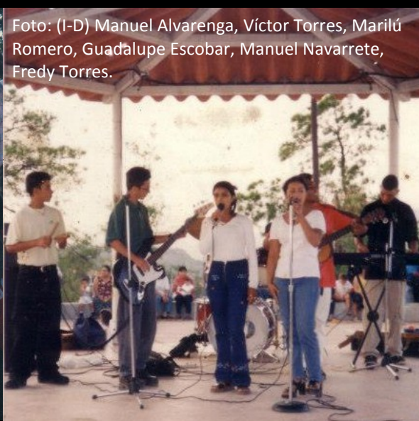
Foto: Primera generación del Grupo Santa Marta.