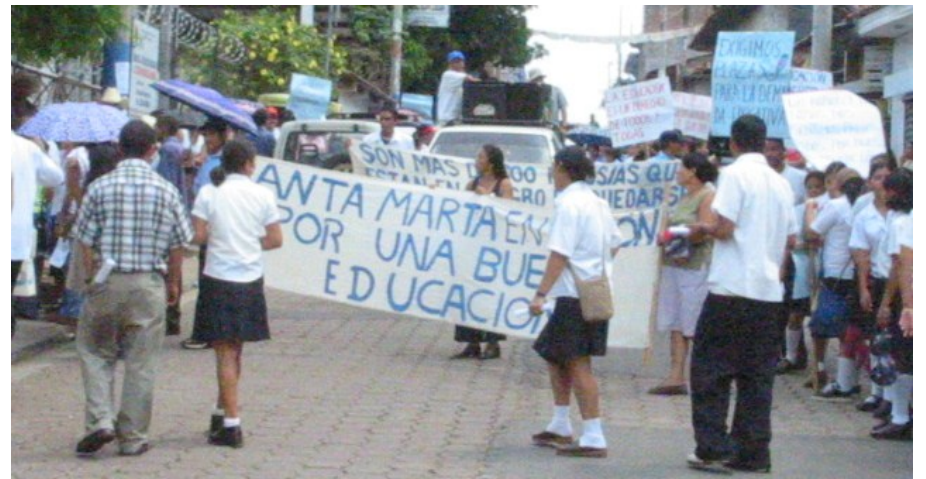
Fotos: Habitantes de la comunidad Santa Marta marchan exigiendo la aprobación del bachillerato general en 2003 y más plazas, frente a las instalaciones de la departamental de educación en Cabañas.

También en 1993, se dan las nivelaciones académicas a ex-combatientes guerrilleros y educadores y educadoras populares para cursar sexto y noveno grado, lo que permitió que la Asociación de Desarrollo Económico y Social Santa Marta (ADES-SM) iniciara la gestión para que las maestras y maestros popula-