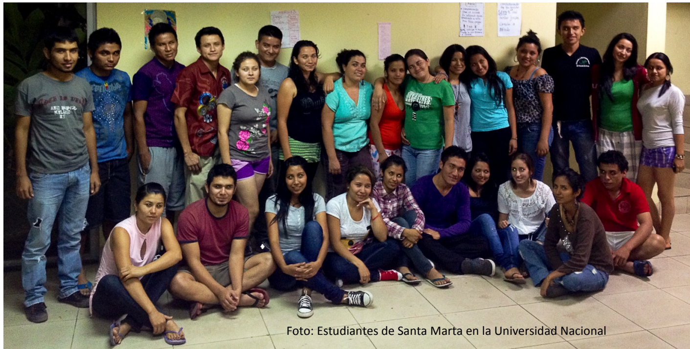
Foto: Estudiantes de Santa Marta en la Universidad Nacional

Pero el proceso de formación no termina aquí, con su graduación, este solo fue el inicio, ya los mismos estudiantes sabían que con estudiar un bachillerato no era suficiente y que había que ir más allá. Tiempo atrás maestros, estudiantes y comunidad habían luchado para ir aumentando el nivel de educación, primero se consiguió llegar hasta un noveno grado, pero eso no era suficiente y cuando llegó el momento se luchó por tener un bachillerato, el cual con la lucha de la comunidad se logró. Pero en Santa Marta no solo queríamos estudiar hasta ese nivel, pretendíamos ir más allá y así como ese grupo de maestros y maestras que un día fueron la universidad, con muchísimo sacrificio, pero con la enorme convicción de llegar muy lejos y cumplir sus objetivos. En el año 2004 se tenía la primera graduación de bachillerato general presencial, y las ganas de seguir estudiando seguían, pero