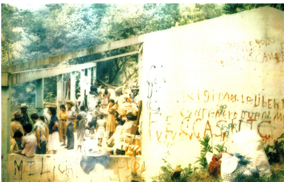
Foto: Esta es la infraestructura del modulo central del Complejo Educativo "10 de Octubre", en el año 1987, cuando el primer retorno.

El proceso educativo que Santa Marta tiene es un lindo ejemplo a replicar en otras parte del país, tomando en cuenta la organización, gestión y participación de las personas de las comunidades para mejorar los niveles de cobertura, índices de analfabetismo y tasa de escolaridad, generando a través de la educación un país distinto y con un mayor aprovechamiento del recurso humano, y mejorando a través de la educación enormemente la vida de las salvadoreñas y salvadoreños.