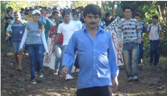
Foto: Caminata de conmemoración a los mártires de Santa Cruz, 2010.