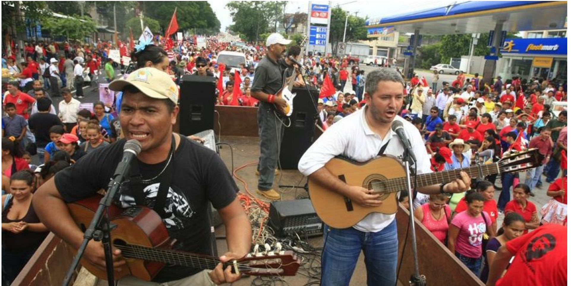
Foto: Integrantes del Grupo Santa Marta, durante la marcha del primero de mayo de 2012.