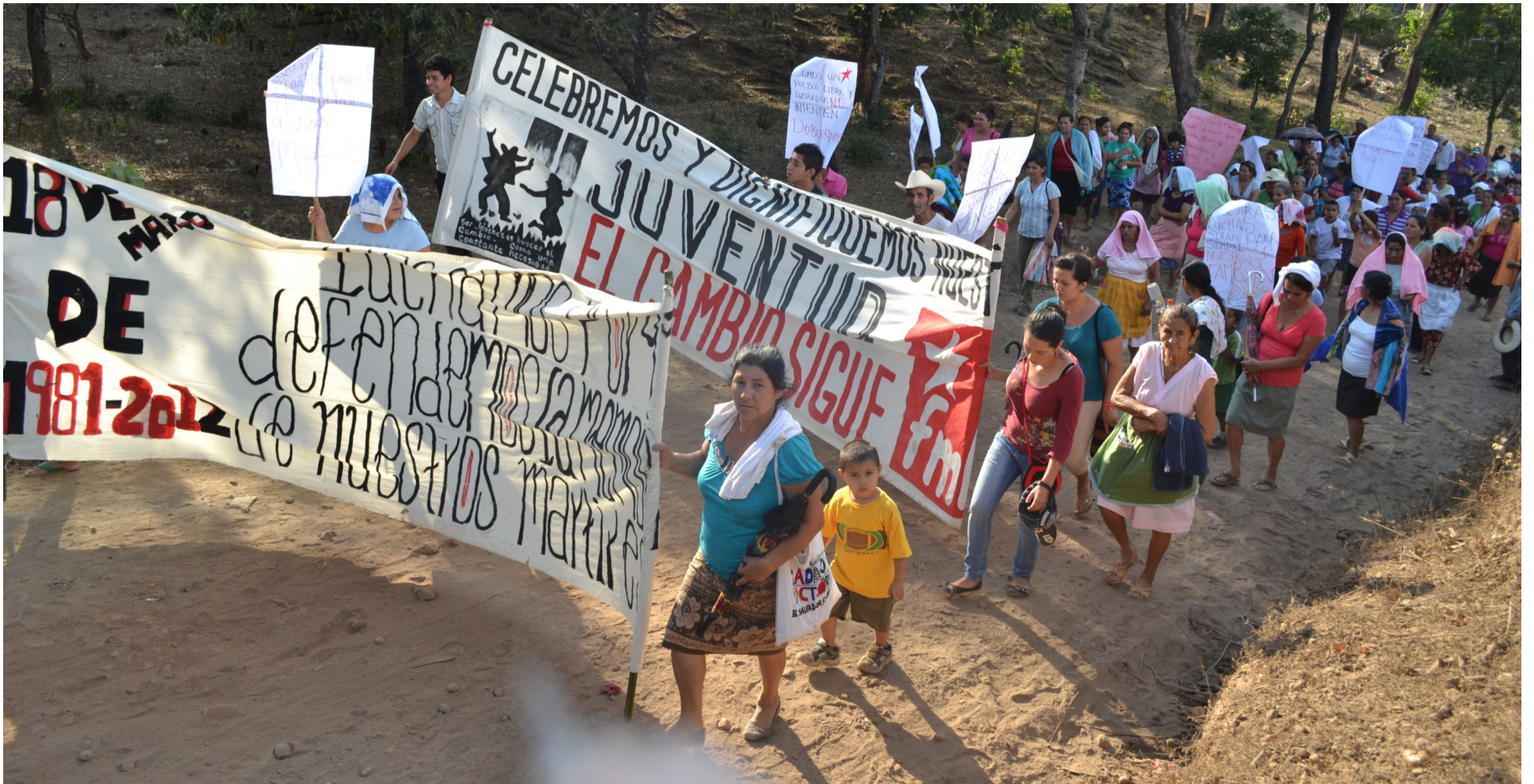
Foto: Población de Santa Marta durante la conmemoración de los 31 años de la masacre del río Lempa y la guinda hacia Honduras.