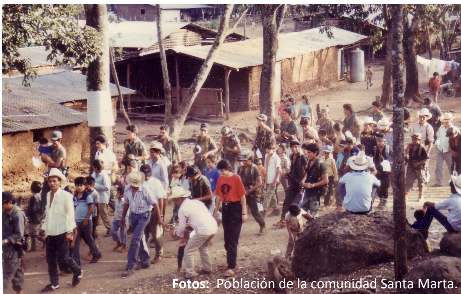
Fotos: Población de la comunidad Santa Marta.

Santa Marta, como una mujer joven, con su vestido de gala, y en la puerta de su casa un proyecto que promete desarrollo y prosperidad para su gente, sigue adelante...