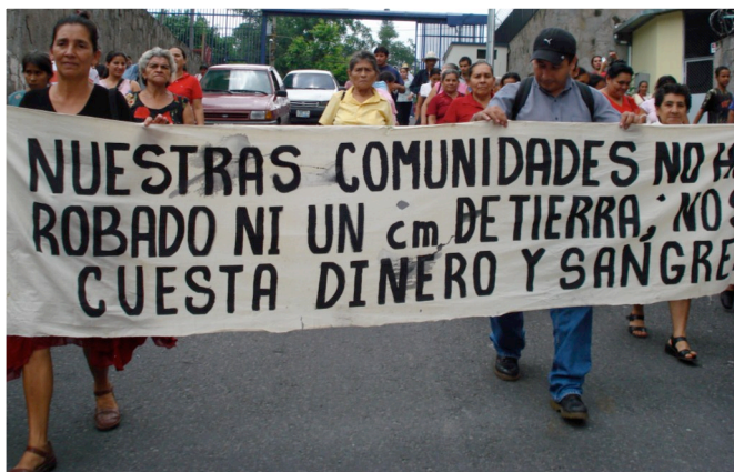
Población de la comunidad Santa Marta en manifestación hacia a la Asamblea Legislativa.

Santa Marta se encuentra encajonada en las sierras fronterizas de Cabañas, ha sido, desde que se fundó, una comunidad muy bien organizada en la defensa de sus voces, dere-