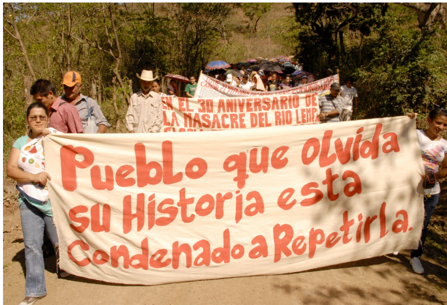
Población de la comunidad Santa Marta, durante el viacrucis del 30 aniversarios de la masacre del rio Lempa, el 18 de marzo de 2011.

La CDHES es una organización encaminada a la defensa de los derechos humanos en el país, y en ese esfuerzo se ha constituido el Centro de Documentación de la Memoria Histórica