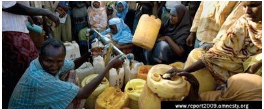
Población de Somalia

fente de noticias y sólo encontramos muerte, destrucción, corrupción y más allá de todo ese derrumbe de valores humanos, encontramos un dolor gigantesco atormentando a millones de personas de todas las edades, de todas las razas y de todo el mundo. Aparentemente, nadie puede hacer nada por ellos, por mucho que quiera, por mucho que intente y por mucho que lo denuncie.