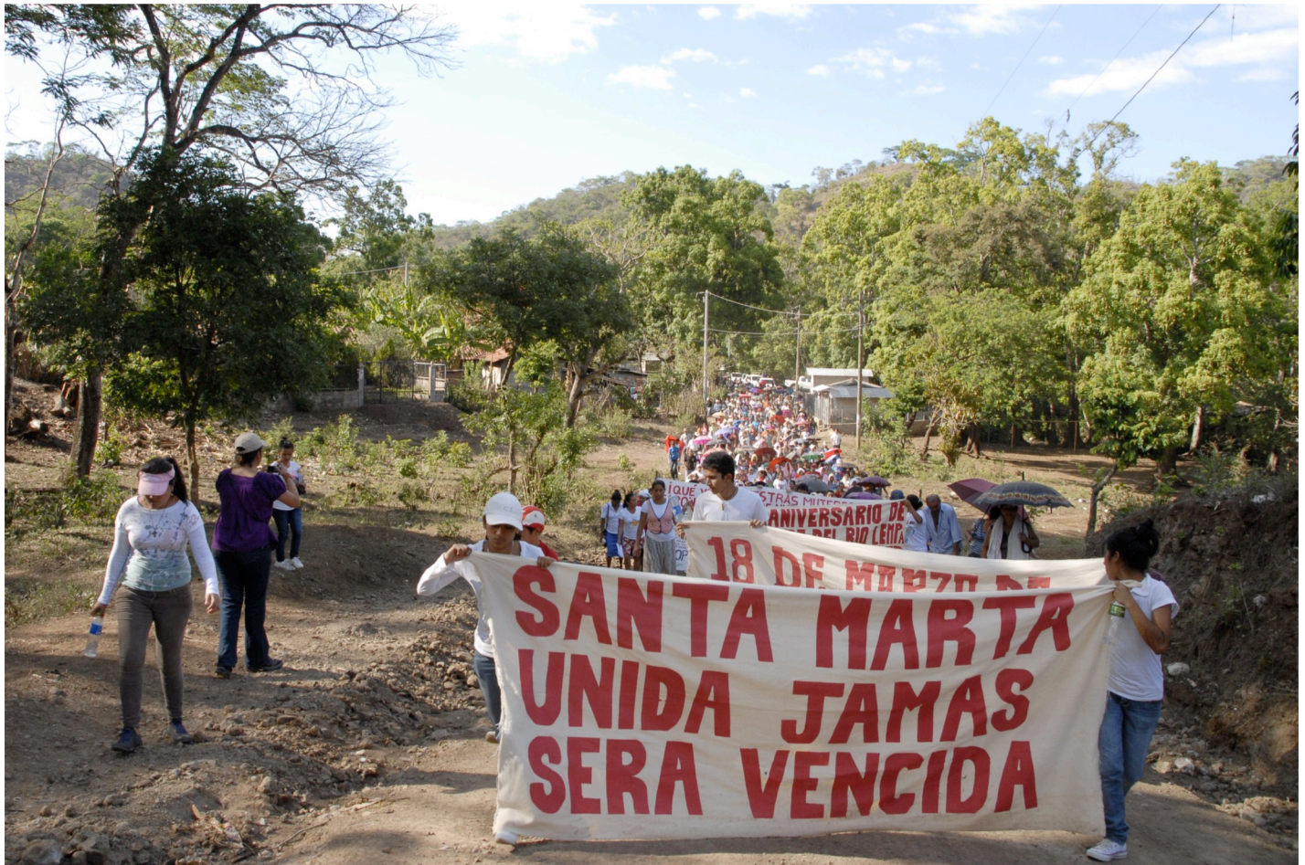
Población de la comunidad Santa Marta durante la conmemoración de los 30 años de masacre en el río Lempa.